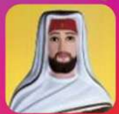
സെന്റ് ജോൺ ബ്രിട്ടോ