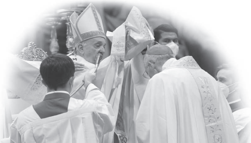
കർത്താമേവ, എന്റെ ഓീവൻ രക്ഷിക്കാൻ വരണമേ അമ്മാച്ചുമാട കാരൂണ്യുത്താൽ എനൊമോചിപ്പിക്കണമേ