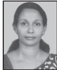
മിനി ടോമി സെന്റ് ജോർജ് ചർച്ച്, മടപ്പാതുരുത്ത്

കാരുണ്യമേ നിൻമുഖ മുറിവുകൾ എന്നോടുള്ള സ്നേഹത്തിൻ ആഴമാണല്ലോ എത്ര ദൂരേക്ക് മാറിയാലും നിഴലായ് പിൻതുടരും സ്നേഹം എന്നുമെന്നെ മാറോടു ചേർക്കുവാനായണയുന്നു നിൻ ഹൃദയത്തോടു ചേർക്കുമ്പോഴും ഞാൻ നിന്റെ ഹൃദയ മുറിവുകൾക്ക് ആഴം കുട്ടുകയാണല്ലോ ഒന്നായിരിക്കാനും ഒപ്പമായിരിക്കാനും വേദന ഒന്നുമേ നീ ഓർക്കാറില്ലല്ലോ നാഥാ... വെറും മണ്ണായ ദേഹം മണ്ണിലലിയുവോളം നിൻ കരുണയാൽ എന്നെ കരുതീടേണമേ നിൻ സ്തുതികളാൽ എൻ ഹൃദയമെന്നും തുടിക്കുവാൻ കനിവാർന്നു നൽവരം നൽകിടേണേ... നാഥാ... കനിവാർന്നു നൽവരം നൽകീടേണേ.